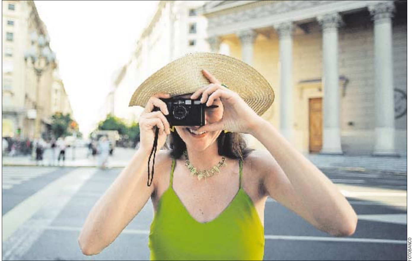
Además de estudiar, los estudiantes tienen la opción de disfrutar de toda la entretención de las ciudades argentinas.

Según explicaron los encargados de entregar este tipo de becas, la asignación de cupos en Chile ha tenido un fuerte aumento de demanda en los últimos años (entre 2003 y 2004 aumentó 335% y sigue creciendo).