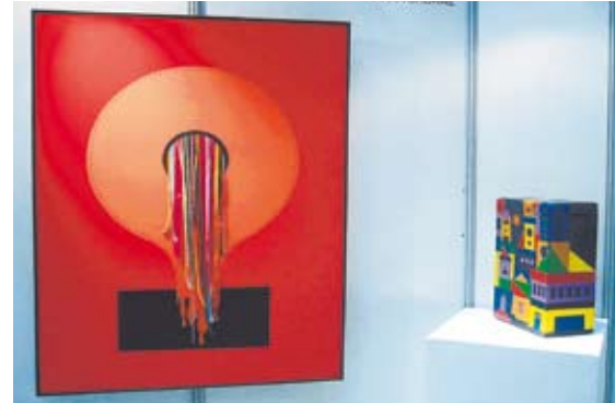
Las urnas son un soporte inusual para el arte.