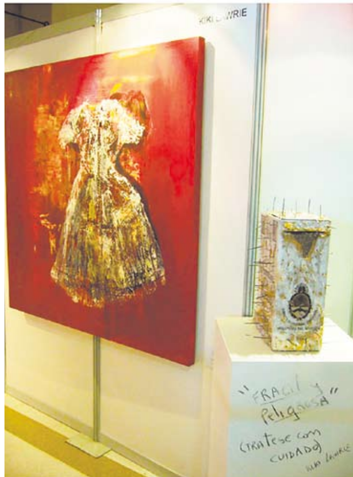
La muestra se presentó en la casa de gobierno argentina.

Que la primera exposición de estas obras fuera de Argentina sea en Santiago, no conlleva