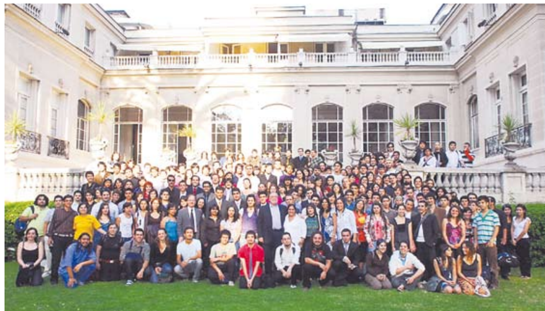
Estudiantes chilenos que en estos momentos cursan diversas materias en Argentina.

Pero no sólo los estudiantes concentran el eje de la integración entre Chile y la Argentina en materia universitaria. Año a año,