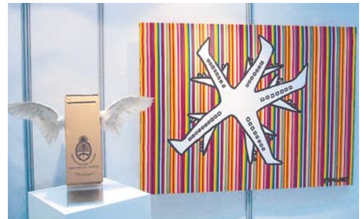
Cada artista interpreta su visión del proceso democrático.