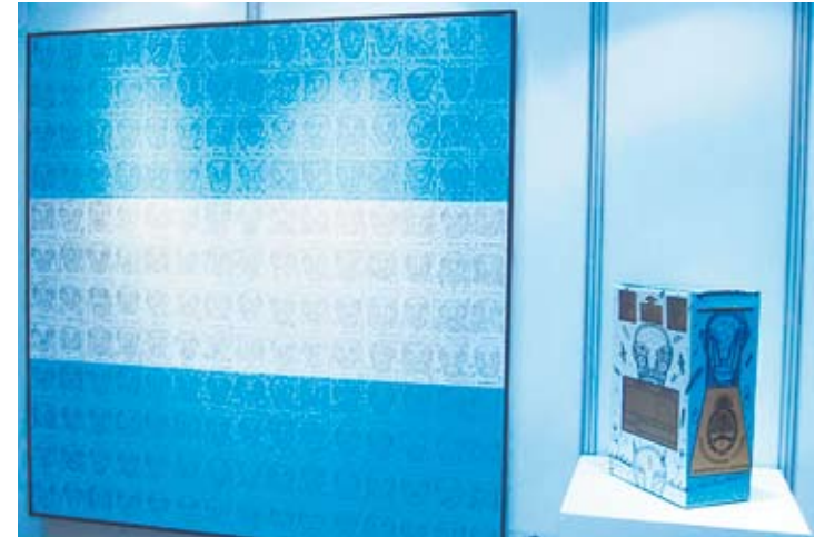
Los motivos están basados en la votación popular.

sólo la aspiración de hacer accesible al público chileno una muestra representativa del arte argentino más contemporáneo, sino también la intención, en las puertas del Bicentenario común, de compartir la similitud de los procesos políticos de transición que vivieron ambos países, resaltando el actual presente de excelentes relaciones en el que se comparten los valores de la integración, el respeto por los derechos humanos y la libertad de expresión.