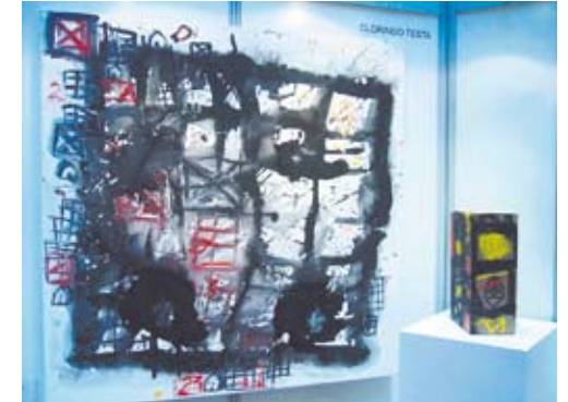
Más de 30 son los artistas que participaron.