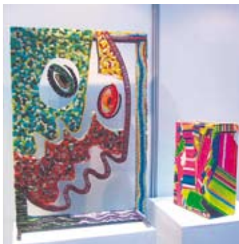
El colorido brilla en cada obra.

Del 11 al 31 de mayo, treinta urnas intervenidas por prestigiosos artistas plásticos argentinos se exhibirán en la Residencia de Vicuña Mackenna 45.